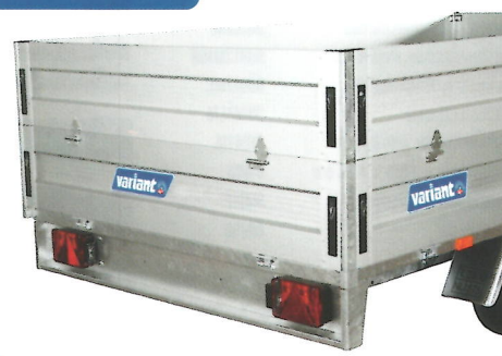
Erhöhen das Raumvolumen des Anhängers. Alle Bordwände sind mit Scharnieren und sind klapp- und abnehmbar. Feine und reinigungsfreundliche Innenseite, Höhe 35 cm.