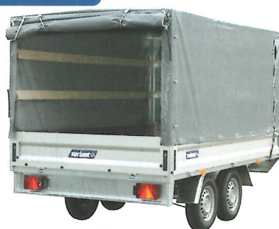
Kräftige Qualität, geschweißtes Gestell und querlaufende Aussteifung. Innenhöhe 210 cm wenn montiert.