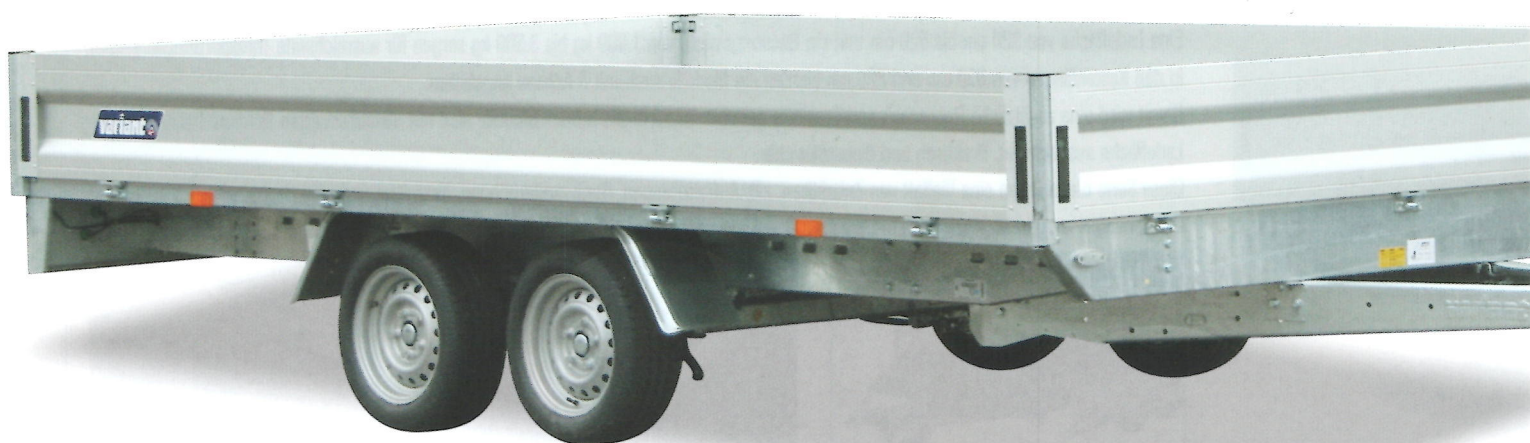
[ Abb. Modell 3525 P4 ]

Innenliegende Verzurrösen, 35 cm hohe Aluminiumbordwände und abnehmbare Eckpfosten, Breite 245 cm