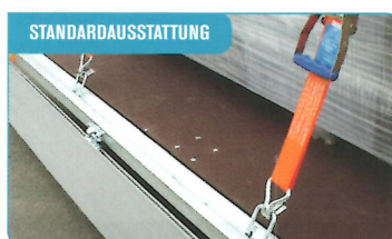
STANDARDAUSSTATTUNG Innenliegende Zurrösen, herunterfallend im Rahmen. Praktisch und robust.