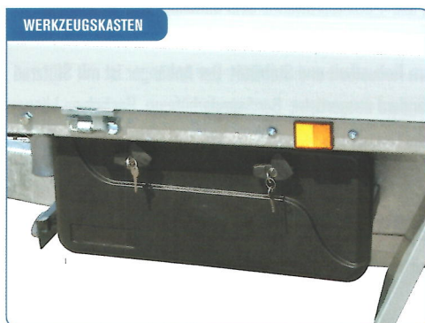
WERKZEUGSKASTEN Robuster Werkzeugkasten mit eingebautem Schloss. Für Montage unter der Ladefläche, 55 x 25 x 30 cm (L x B x H).

Kann mit einem Gesamtgewicht von 3.500 kg bis zu 2.700 kg geliefert werden.