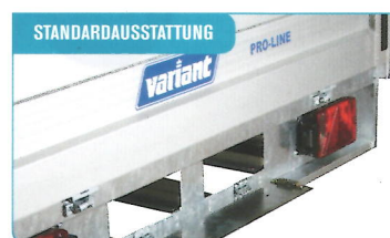
STANDARDAUSSTATTUNG Abschließbarer Bohlenschacht in der Länge von 250 cm. Auffahrrampen können zugekauft werden, siehe unter dem Anhängermodell.