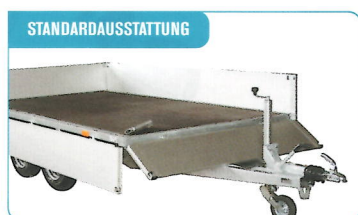
STANDARDAUSSTATTUNG Abnehmbare Bordwände und abnehmbare Eck- u. Mittelpfosten, ermöglichen eine einfache Beladung.