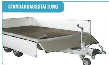
STANDARDAUSSTATTUNG Abnehmbare Bordwände und abnehmbare Eck- u. Mittelpfosten, ermöglichen eine einfache Beladung.