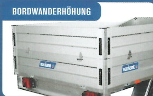
BORDWANDERHÖHUNG Erhöhen das Raumvolumen vom Anhänger. Klappbar und abnehmbar. Höhe 35 cm.