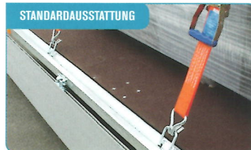
STANDARDAUSSTATTUNG Innenliegende Zurrösen, herunterfallend im Rahmen. Praktisch und robust.