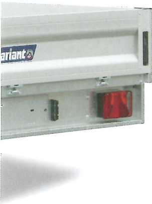
[ Abb. Modell 3021 P4 ]

Die Anhänger werden ab Werk auch mit anderen Radgrößen angeboten. Die Anhänger werden mit einem kräftigen Automatikstützrad geliefert.