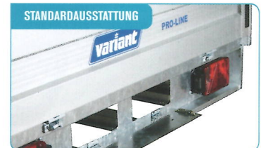
STANDARDAUSSTATTUNG Abschließbarer Bohlenschacht in der Länge von 250 cm. Auffahrampen können zugekauft werden, siehe unter dem Anhängermodell.