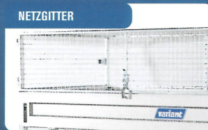
NETZGITTER Robuste Qualität mit Öffnung vorne und hinten. Höhe 60 cm.