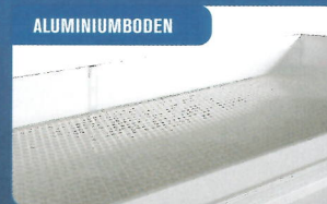
ALUMINIUMBODEN Robuster Alu-Dielenboden erhöht die Lebensdauer des Anhängers. Rutschfest.

Siehe Universalausstattung auf Seite 38-39. Unten abgebildete Teile sind Zubehör.