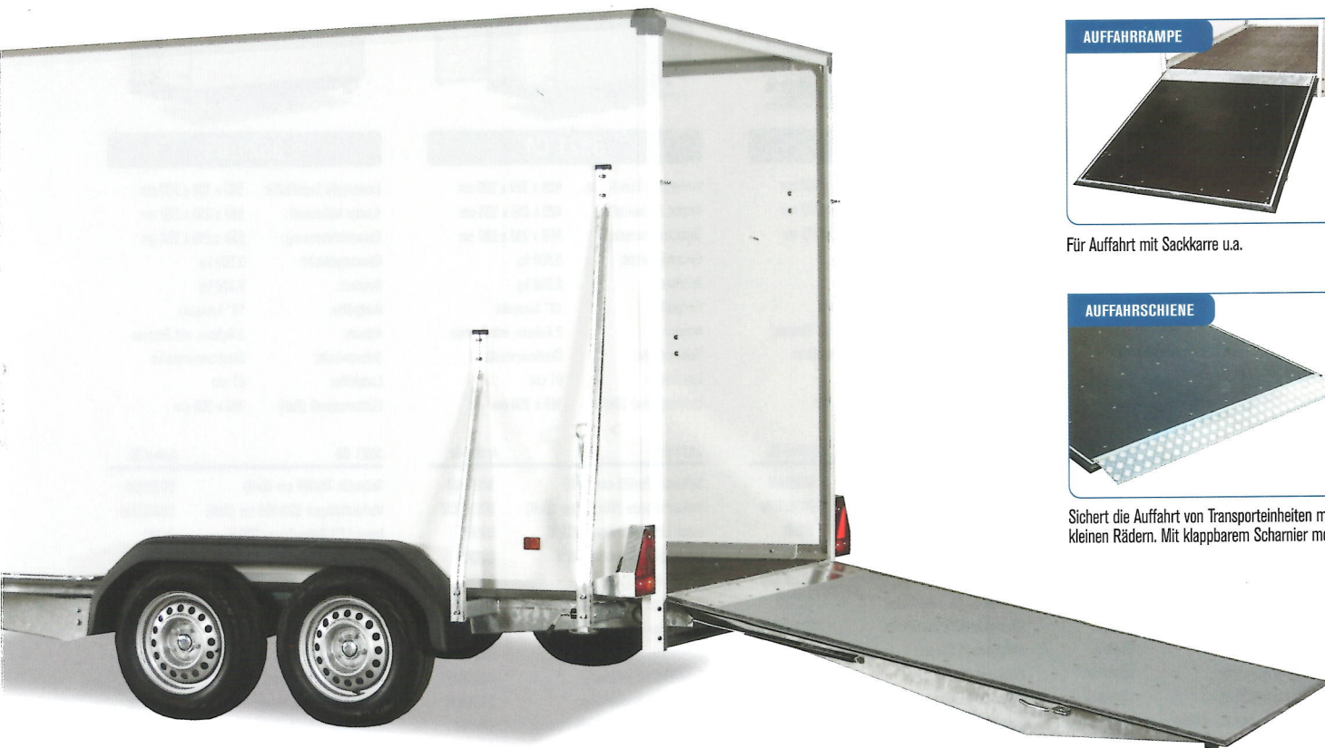
[ Abb. Modell 2005 CVB35 mit Auffahrrampe - Zubehör ]

Wird an der Stirnwand montiert. Ist immer gut, es dabei zu haben.