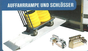
AUFFAHRRAMPE UND SCHLÖSSER

2 Stück werden an den Längsseiten montiert. Querstange kann zugekauft werden.