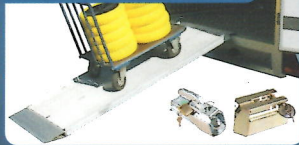
AUFFAHRAMPE UND SCHLÖSSER

Breitrampe. 70 cm – 750 kg. Schlösser. Um Ihren Anhänger zu sichern.